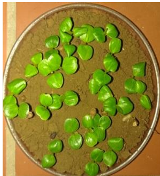
Fig. 3. Plántulas de C. cowellii germinadas en tierra del hábitat natural, 100% de germinación.

adecuarla a las necesidades de manejo ex situ . No obstante, la mayor eficiencia de la germinación se alcanza cuando la siembra se realiza durante los 30 días posteriores a la cosecha.